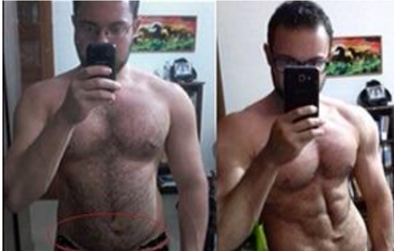
Esta é minha transformação em 80 dias

O Objetivo colocando esse antes/depois é apenas para mostrar que eu sei o caminho.